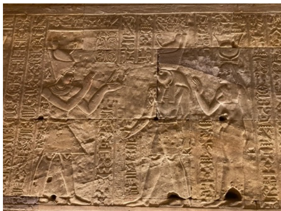
Offrande du faucon à Horus d'Edfou et Hathor

Le samedi 13 juin 2026 , nous proposons la 59 e Journée d'Égyptologica consacrée au dieu Horus . Ce thème sera abordé en une approche plurielle, au cours de la matinée et de l'après-midi.