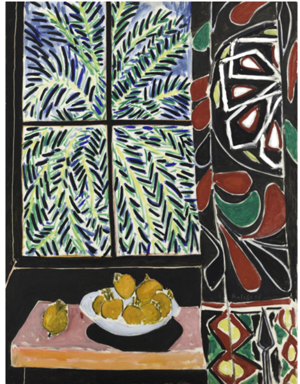
H. Matisse Intérieur avec rideau égyptien, 1948

POUR UNE ANNÉE 2026 TOUTE EN PALMES RAYONNANTES !