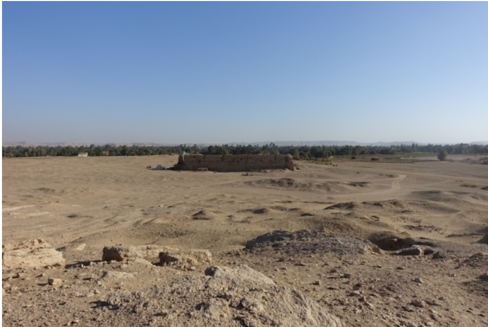
Hierakonpolis vue de l'enceinte protodynastique et des montagnes d'Elkab

Les découvertes majeures faites à Hiérakonpolis à la fin du XIX e siècle, comme la palette de Narmer, ont mis en lumière l'importance cruciale de ce site pour comprendre l'émergence des structures politiques, sociales et religieuses entre l'époque néolithique et les premières dynasties. Actuellement, les fouilles continuent dans les cimetières prédynastiques et l'enceinte protodynastique. En revanche, la ville et le temple à l'époque dynastique restent encore largement méconnus.