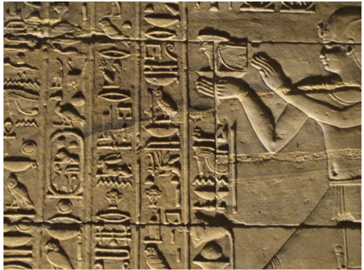
Temple d'Edfou, le geste précis du ritualiste

La visite d'un temple égyptien, généralement, marque les voyageurs modernes par la monumentalité de l'édifice, la qualité des décors et une sorte de magie qui s'en dégage, même près de deux mille ans après sa fermeture aux cultes. Pourtant, nous ne voyons finalement qu'une petite partie de ce qui devait ressembler une construction de ce type.